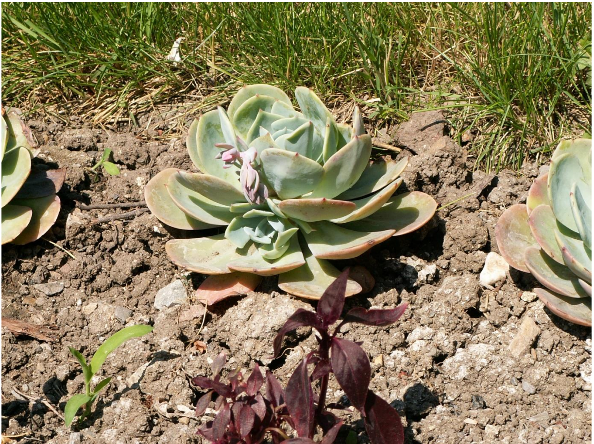
Рис. 9. Echeveria glauca (Baker) Морген на цветнике около АЗС на ЮБК.