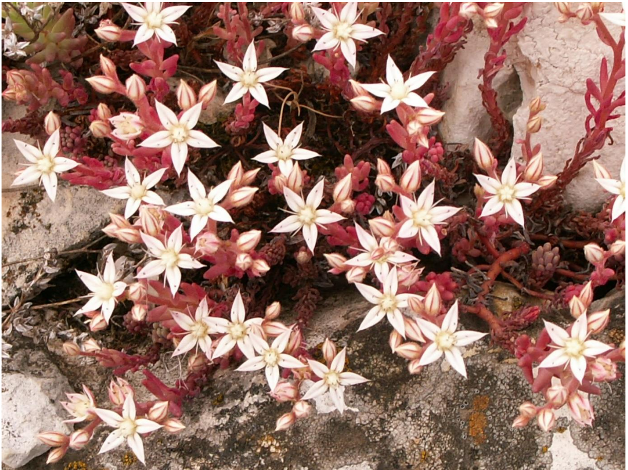
Рис. 7. Sedum pallidum Vieb. subsp. pallidum на Караби яйле в 2005 г..