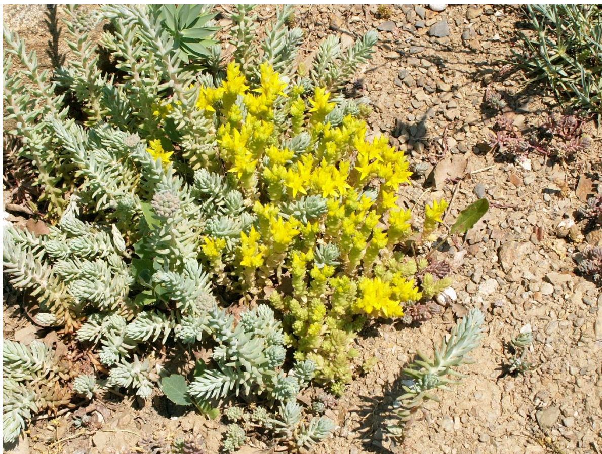
Рис. 3. Sedum reflexum L. (вместе с S. acre L.) на обочине дороги на Южный Берег Крыма.