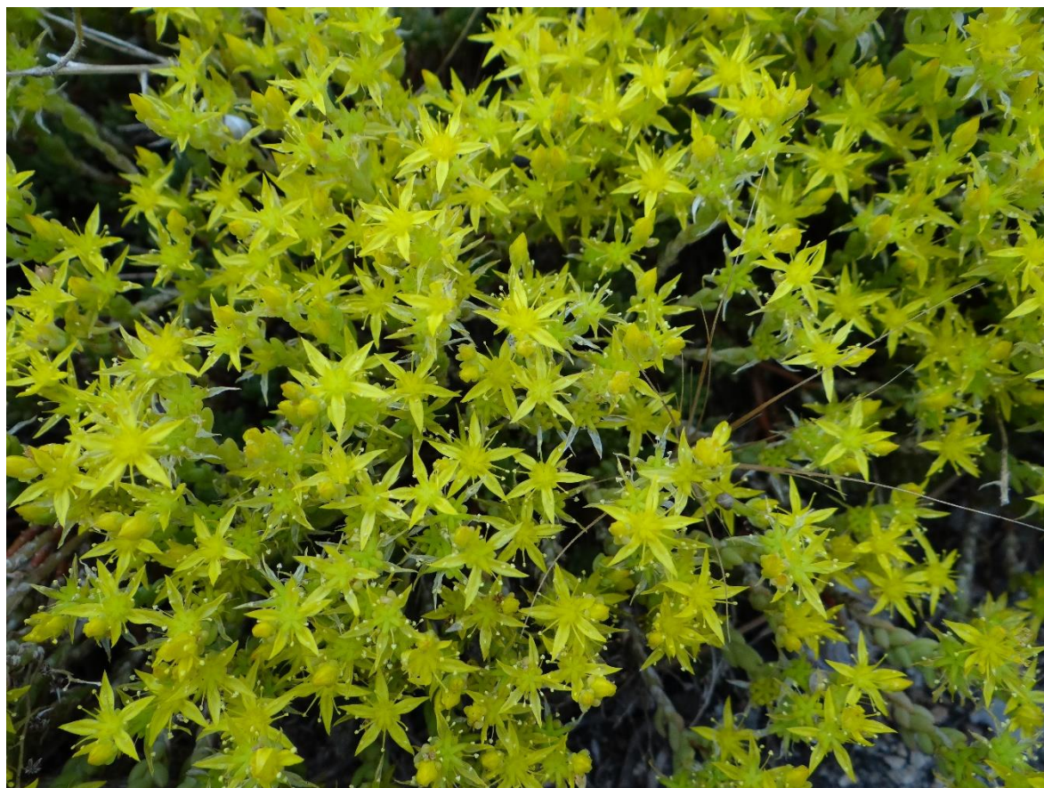
Рис. 4. Одичавший Sedum reflexum L. на ЮБК среди Opuntia fragilis.