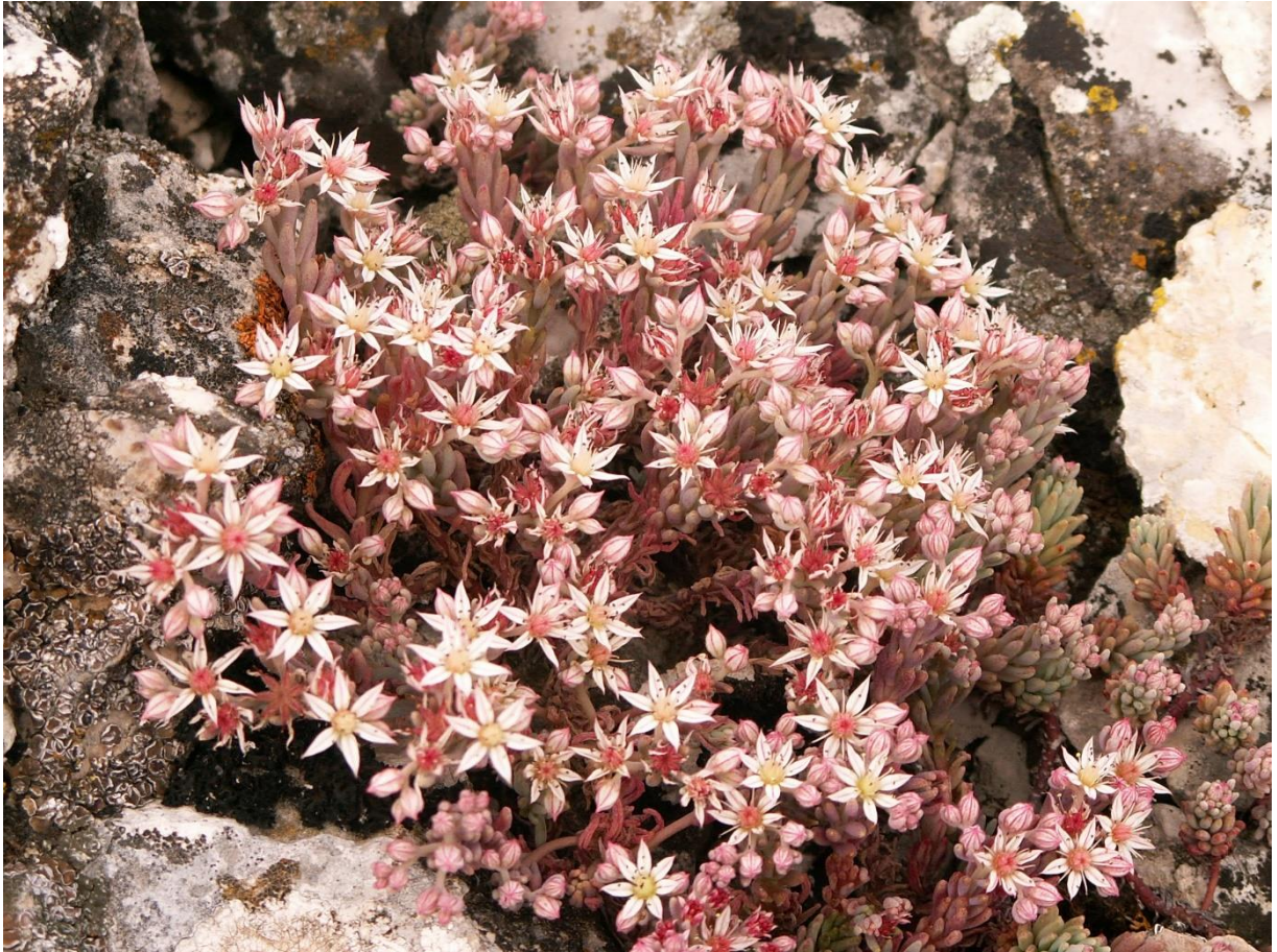
Рис. 5. Sedum hispanicum L. на Караби яйле в 2005 г..