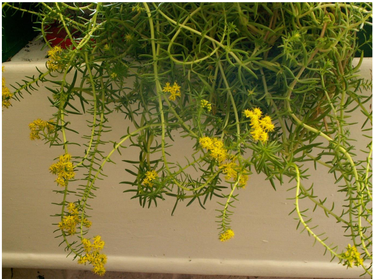
Рис. 10. Sedum mexicanum Britt. культивируется у входа в фойе санатория «Утес» на мысе Плака.