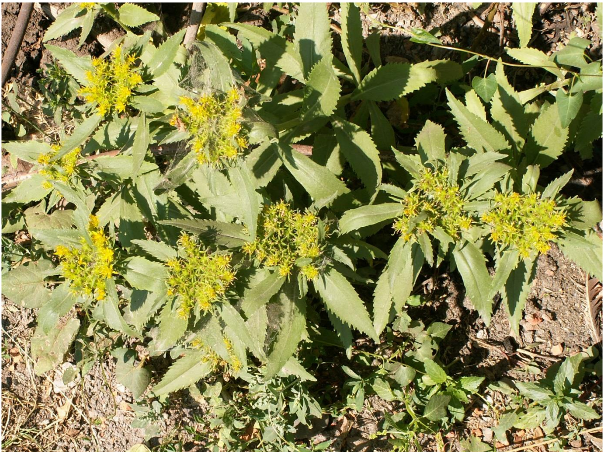
Рис. 8. Aizopsis aizoan (L.) Grulich в частном саду в г. Белогорске.