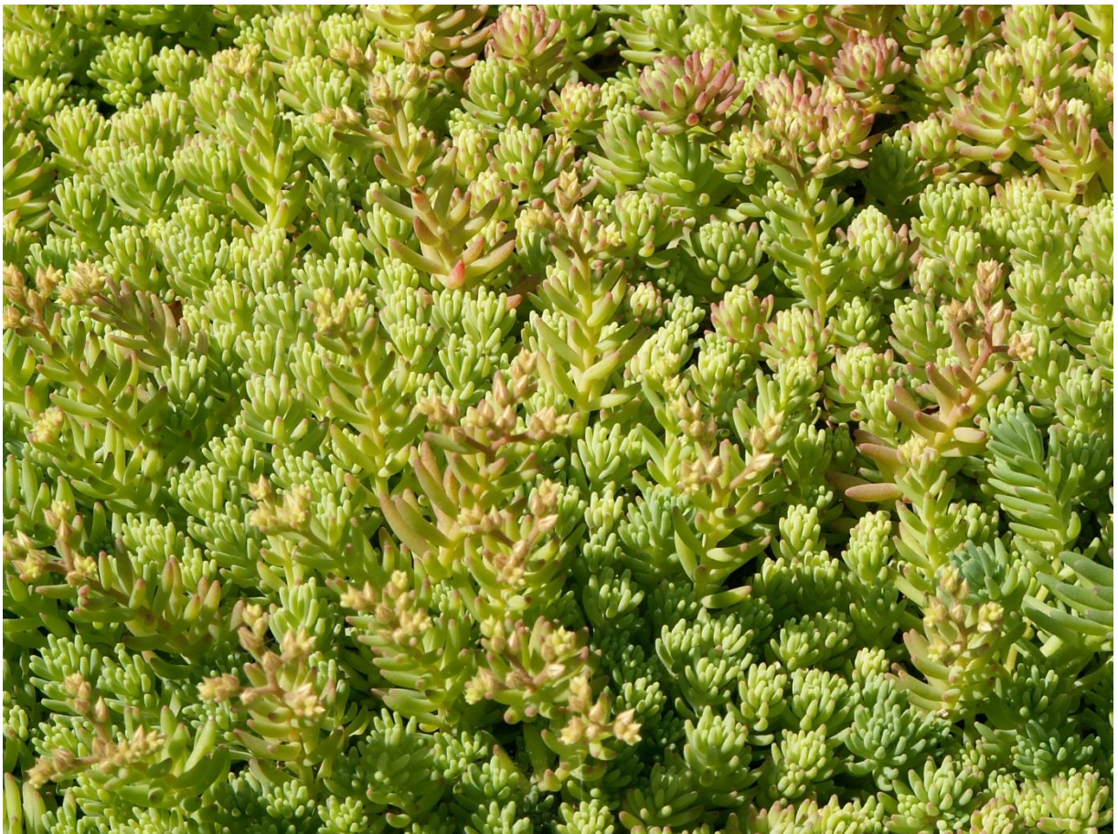
Рис. 6. Sedum pallidum Vieb. subsp. bithunicum в культуре на ЮБК