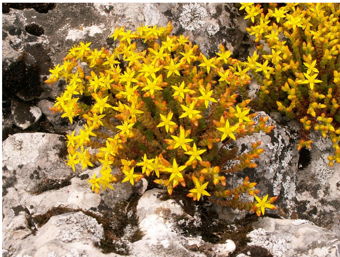
Рис. 2. Sedum acre L. на Караби-яйле в 2005 г..