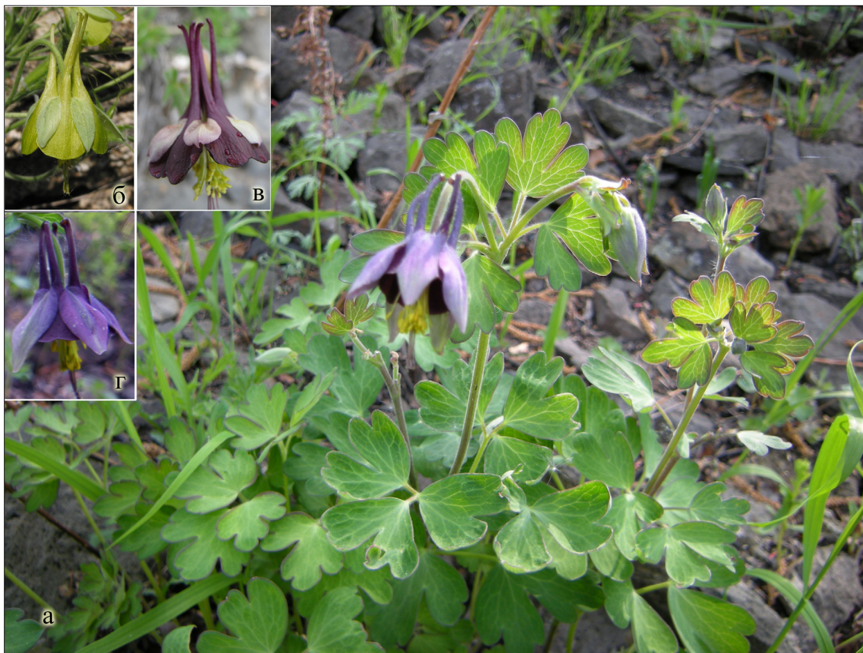
Фото 1. а – общий вид Aquilegia kamelinii; б – цветок A. viridiflora из locus classicus; в – цветок A. atropurpurea из Тувы; г – цветок Aquilegia kamelinii .

ся от основания, с длинными, на конце крючкато-изогнутыми столбиками (рис. 1д).