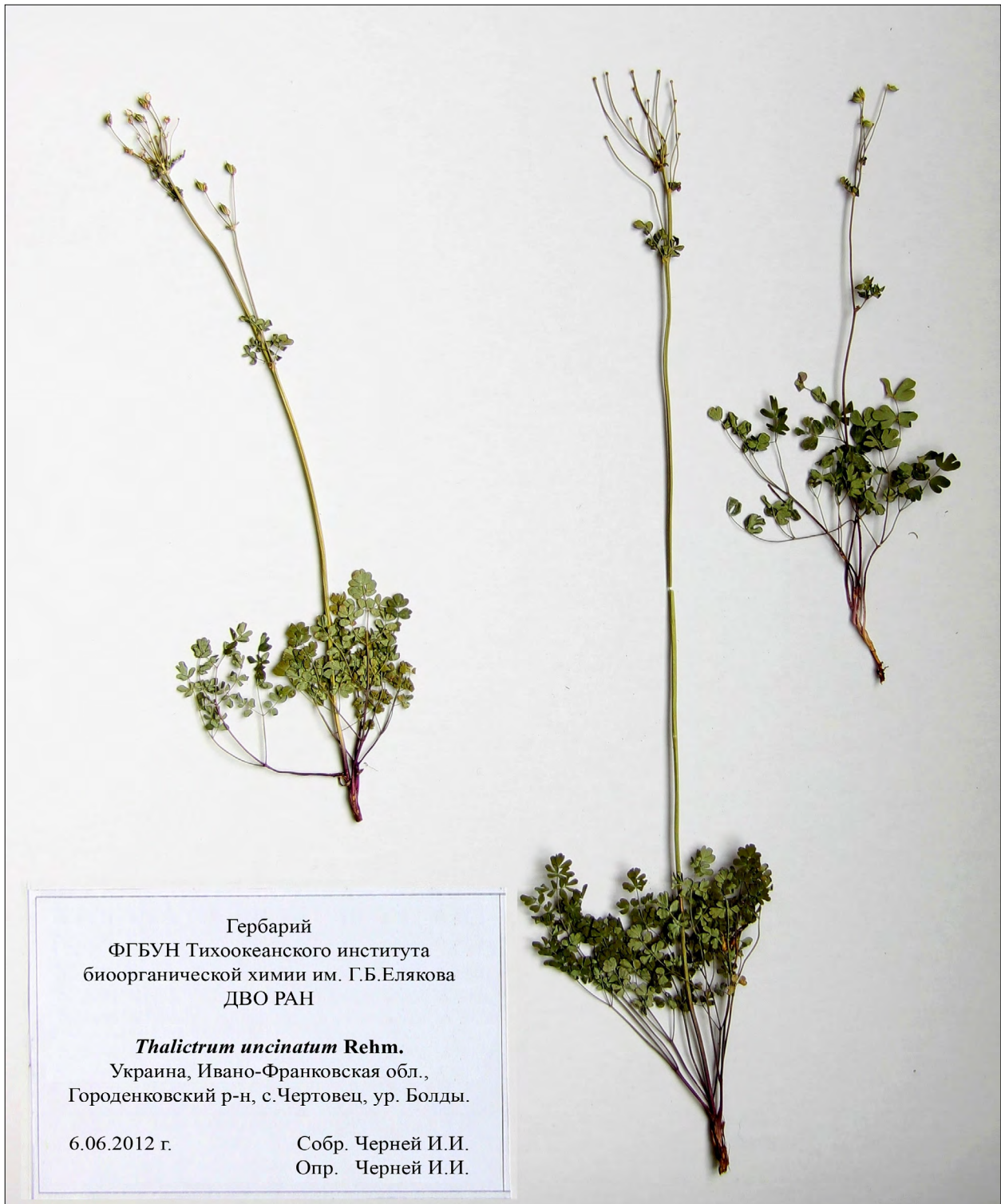
Рис. 2. Thalictrum uncinatum Rehm.

Blocki B. Untitled letter in "Correspondenz" // Oesterr. Bot. Zeitschr., 1888. – Vol. 38. – P. 181–182.