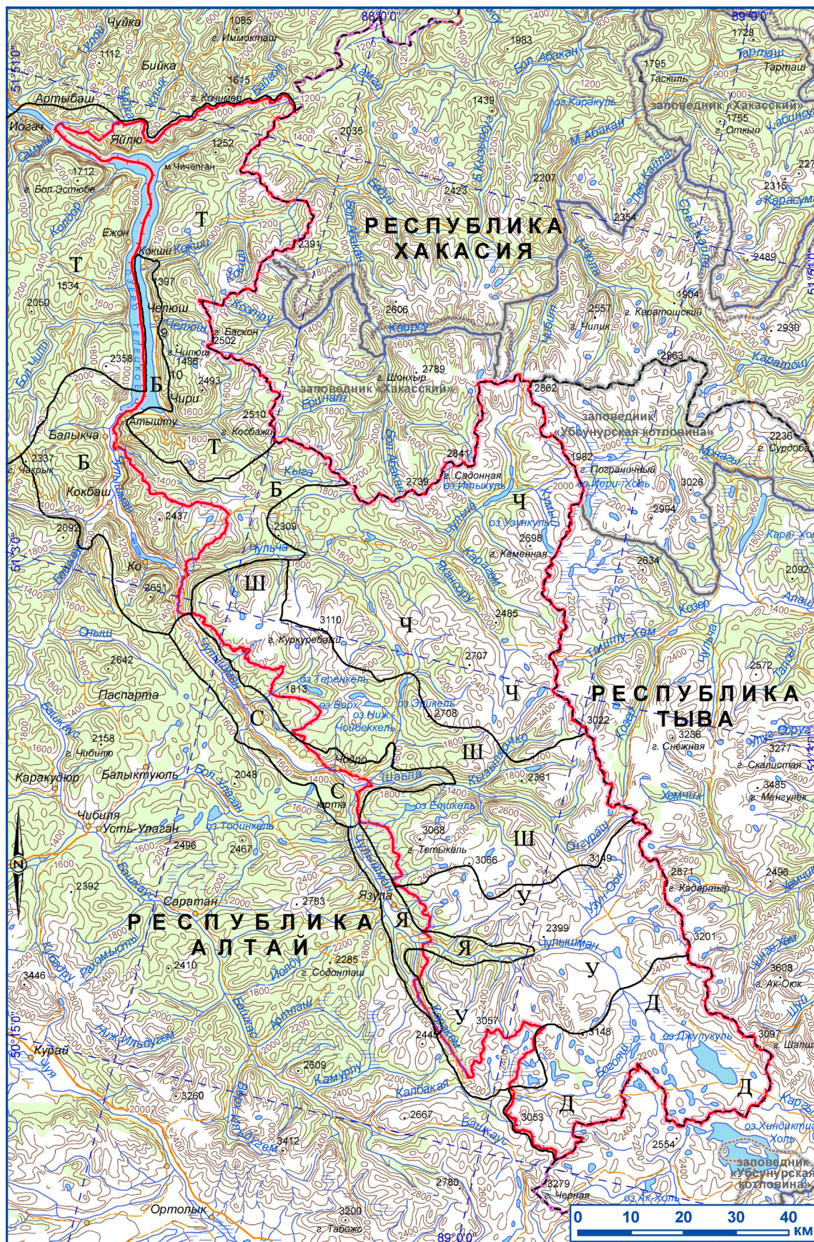
Рис. 1. Флористические районы Алтайского заповедника и сопредельных территорий Республики Алтай (Zolotukhin, 1987, 1994, 1996; с уточнениями – Н. И. Золотухин, данная картосхема). Обозначения флористических районов: Б – Балыкчинский, Д – Джулукульский, С – Среднечулышманский (Катуярыкский), Т – Телецкий, У – Узуноокский, Ч – Чульчинский, Ш – Шавлинский, Я – Язулинский.