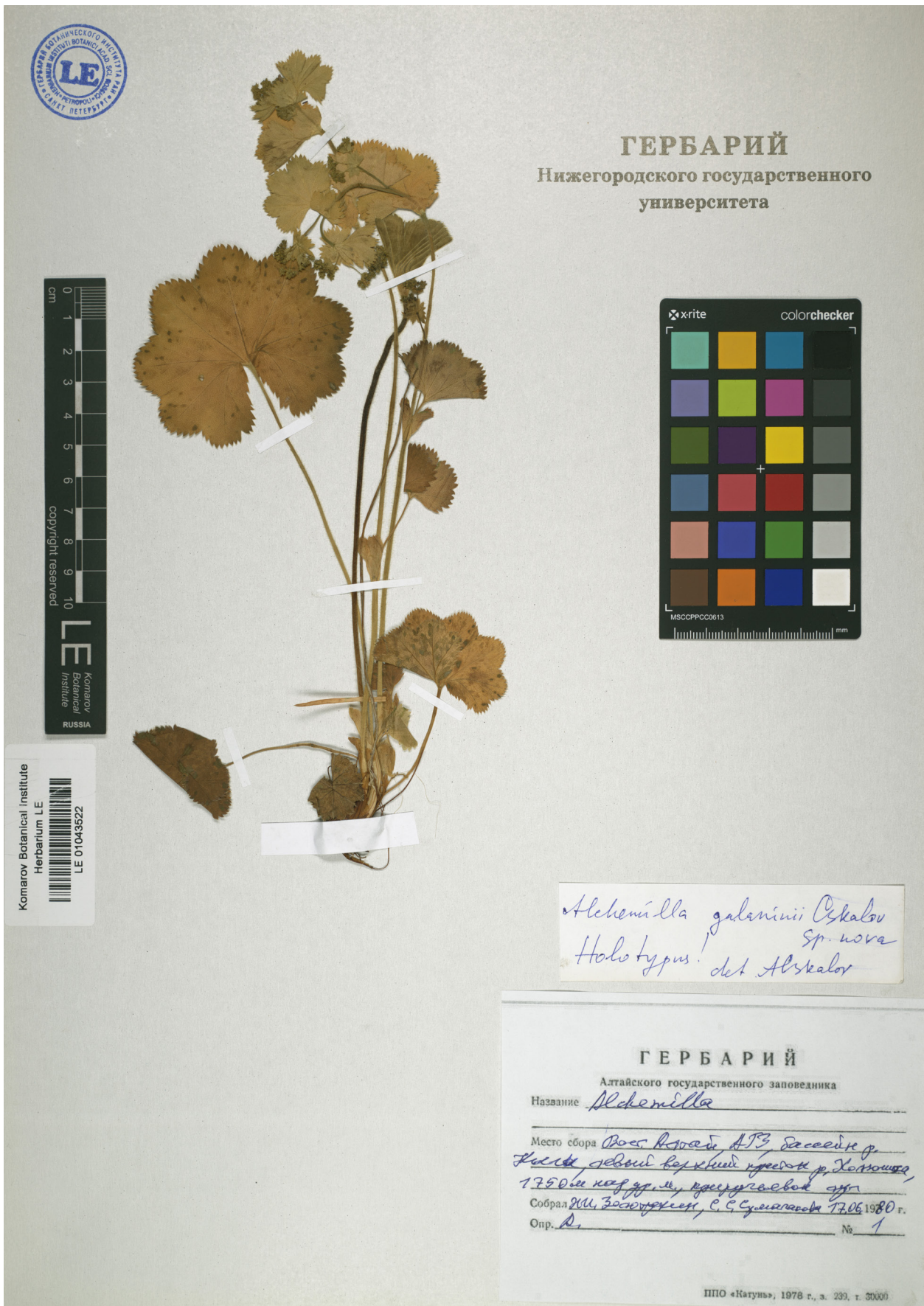
Рис. 3. Голотип Alchemilla galaninii .