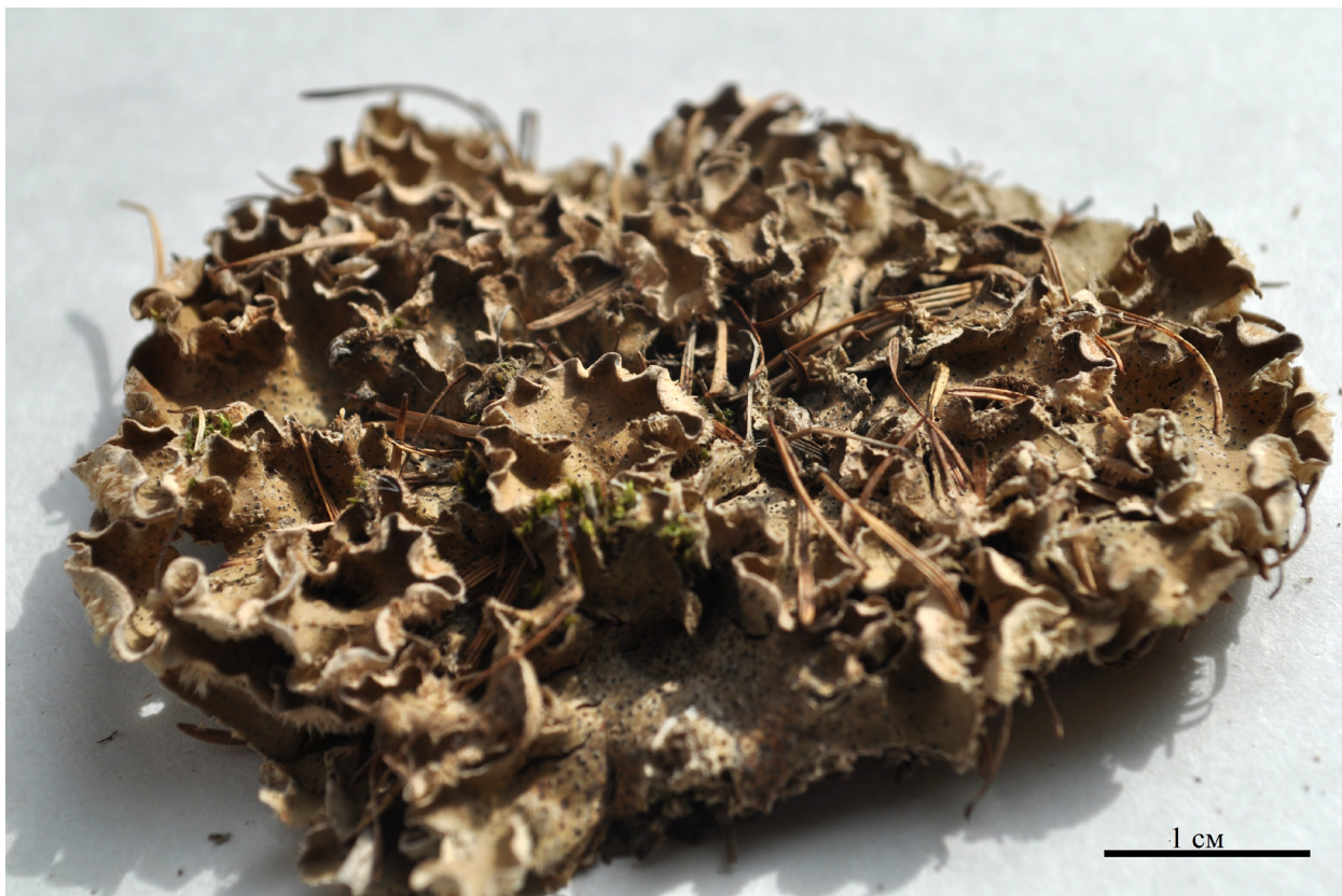
Рис. 3. Общий вид таллома Peltigera ponojensis .