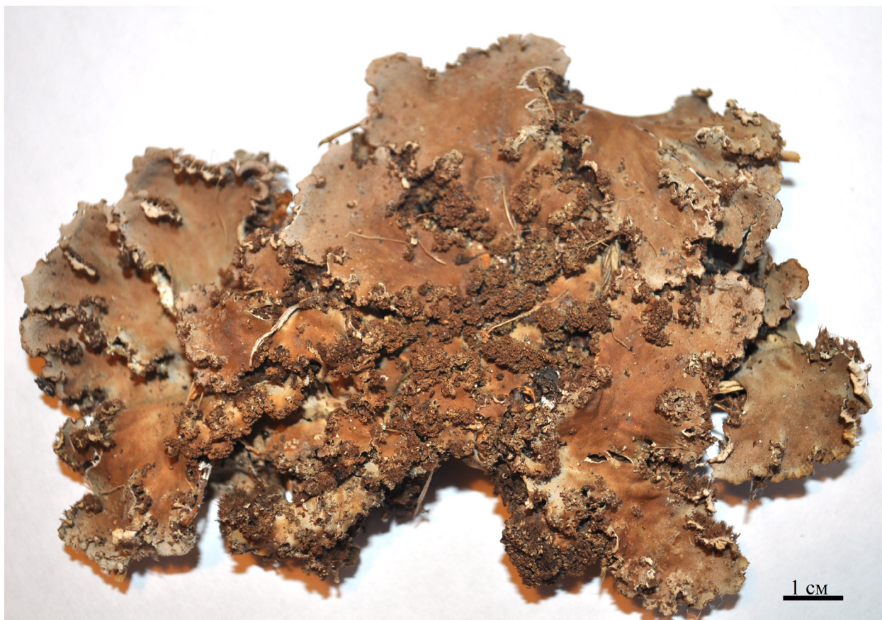
Рис. 2. Общий вид таллома Peltigera continentalis .

Общее распространение: Европа, Азия, Сев. Америка, Африка (Vitikainen, 2007). Вид распространен по всей России (Urbanavichus, 2010). На Дальнем Востоке встречается на Чукотке (Andreyev et al., 1996), в Хабаровском и Приморском краях, на Сахалине, Шикотане (Chabanenko, 2002) и Камчатке (Neshataeva et al., 2005).