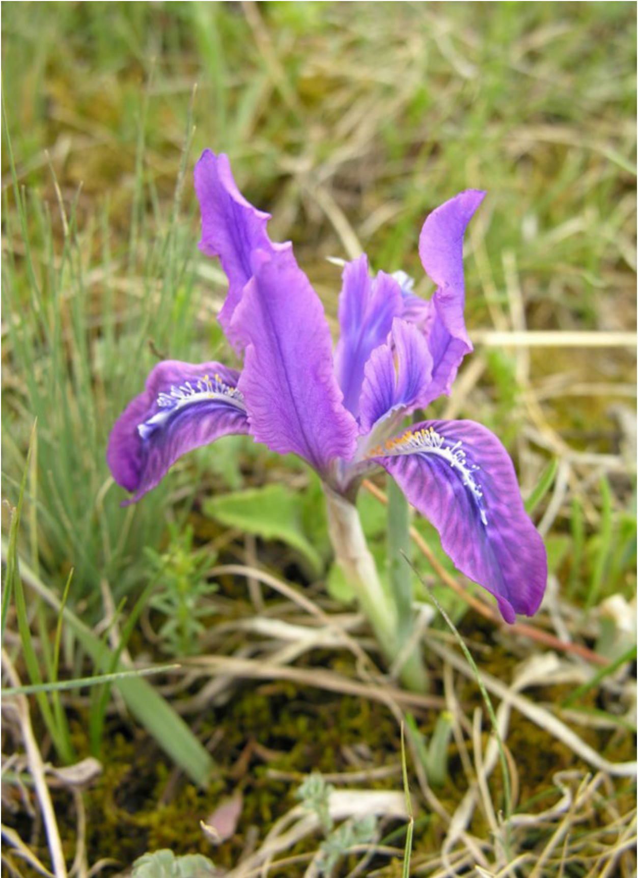
Рис. 5. Iris tigridia на Алтае.