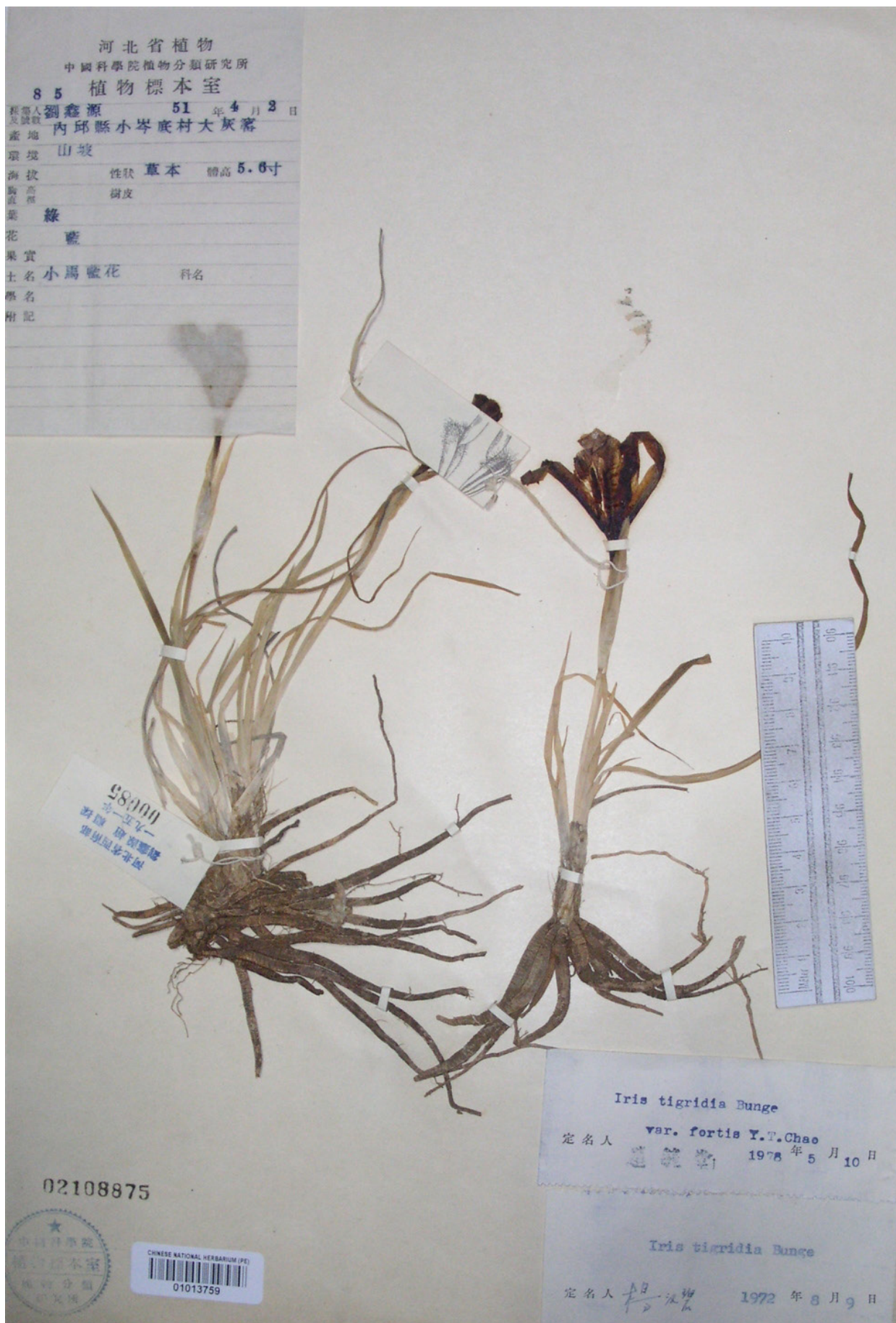
Рис. 2. Гербарный образец Iris tigridia var. fortis (цветущий) (PE 01013759).