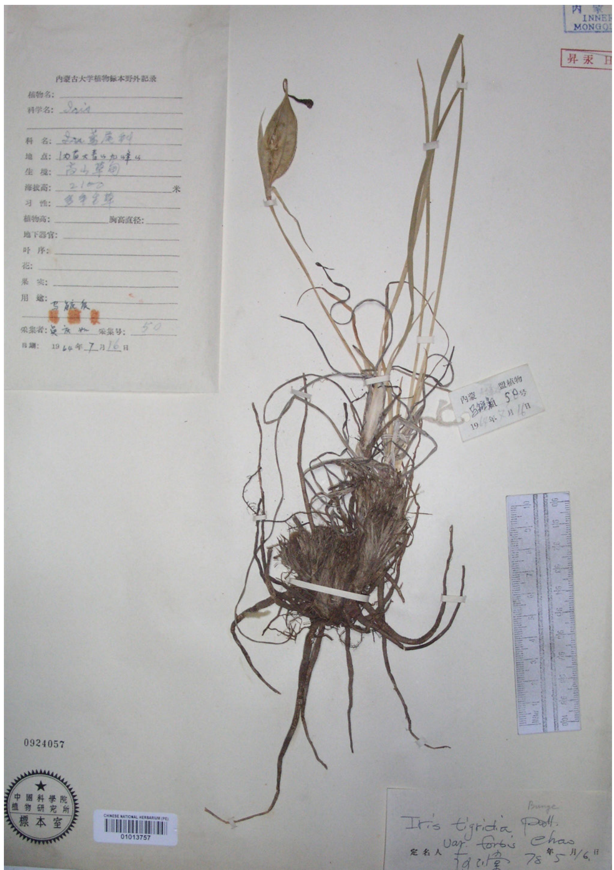
Рис. 4. Гербарный образец Iris tigridia var. fortis (плодоносящий) (PE 01013757).