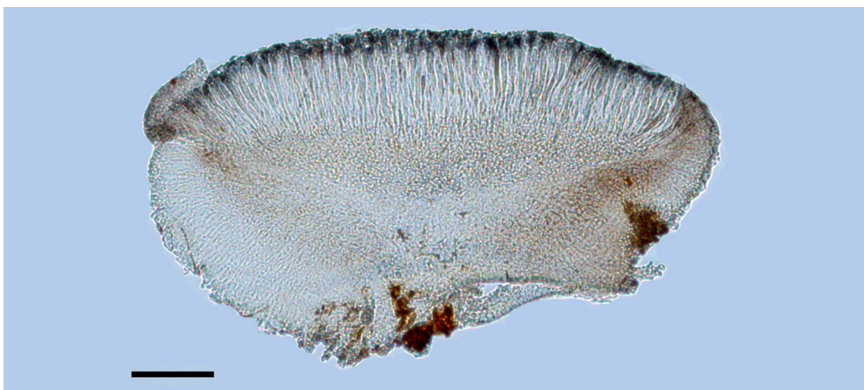
Рис. 2. Многочисленные кристаллы в эксципуле Bacidia absistens , видимые при прохождении поляризационного света (LE L-11701). Шкала = 50 мкм.

Распространение. Bacidia absistens первоначально описан из Франции. Вид имеет широкое распространение и довольно часто отмечается для территории Европы, встречаясь главным образом в регионах с атлантическим влиянием, но и в областях с более континентальным климатом, например, в Альпах (Van den Boom, Clerc, 2000). Встречается практически повсеместно от юга Скандинавии и Британских островов до Средиземноморского региона (Австрия, Великобритания, Германия, Греция, Испания, Италия, Норвегия, Португалия, Словакия, Словения, Турция, Франция, Швейцария, Швеция), а