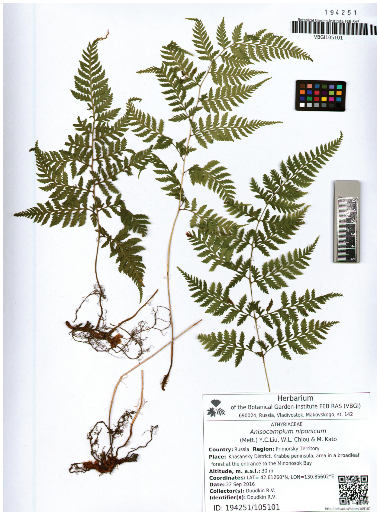
Рис. 2. Гербарный образец Anisocampium niponicum .