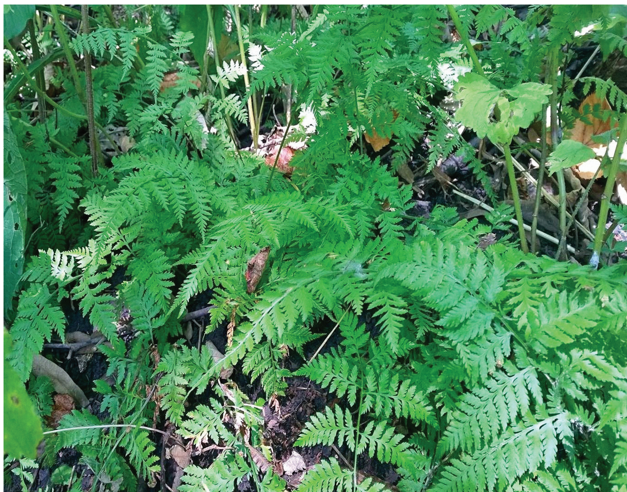
Рис. 3. Anisocampium niponicum в естественном местообитании.

Обнаруженная нами популяция A. niponicum расположена в охранной зоне Дальневосточного морского заповедника (ФГБУ «Земля леопарда») в южной части п-ова Краббе (рис. 2) и состоит из двух участков, находящихся на удалении 12 м друг от друга. Этот вид относится к группе длиннокорневищных папоротников, поэтому произвести подсчет общего количества экземпляров не представлялось возможным. Первый участок с A. niponicum , площадь которого составила не менее 25 м 2 , располагается по гребню увала на опушке широколиственного леса с преобладанием Tilia mandshurica Rupr. (рис. 3). В древесном ярусе, сомкнутость которого составляла около 80 %, отмечены два ослабленных экземпляра Quercus mongolica Fisch. ex Ledeb. Кустарниковый ярус развит слабо и представлен двумя видами