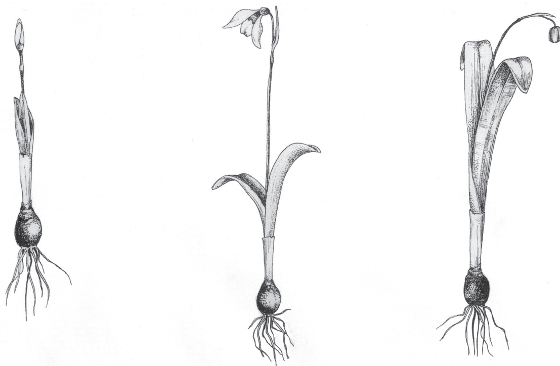
Рис. 5 / Fig. 5. Вид Galanthus woronowii в фенологические фазы бутонизации, цветения и плодоношения (автор И. Н. Тимухин, см. Timukhin, Tuniyev, 2002).

70,8 пг у G. woronowii и 56,14 пг у G. lebedevae (см. ниже в обсуждении) (табл.).