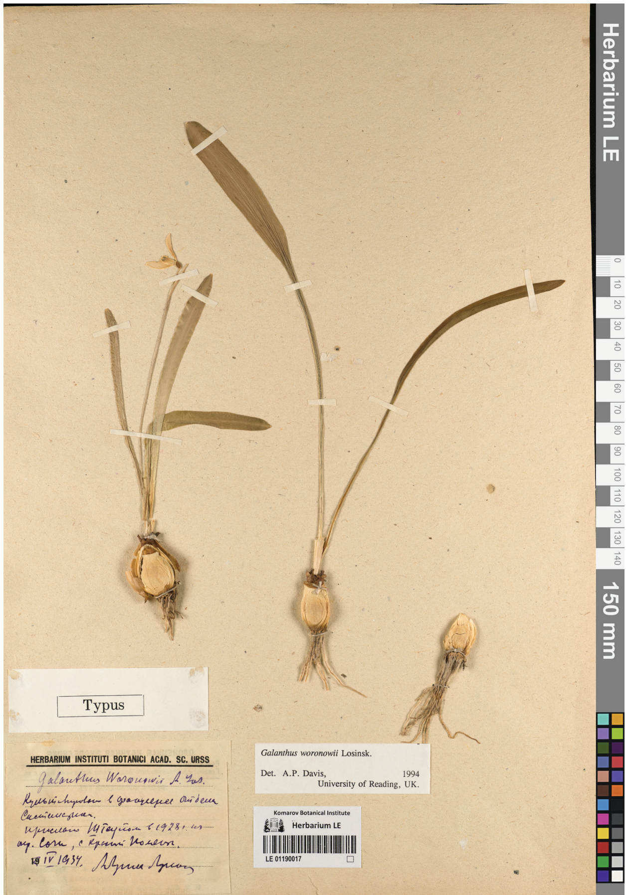
Рис. 6 / Fig. 6. Голотип Galanthus woronowii .