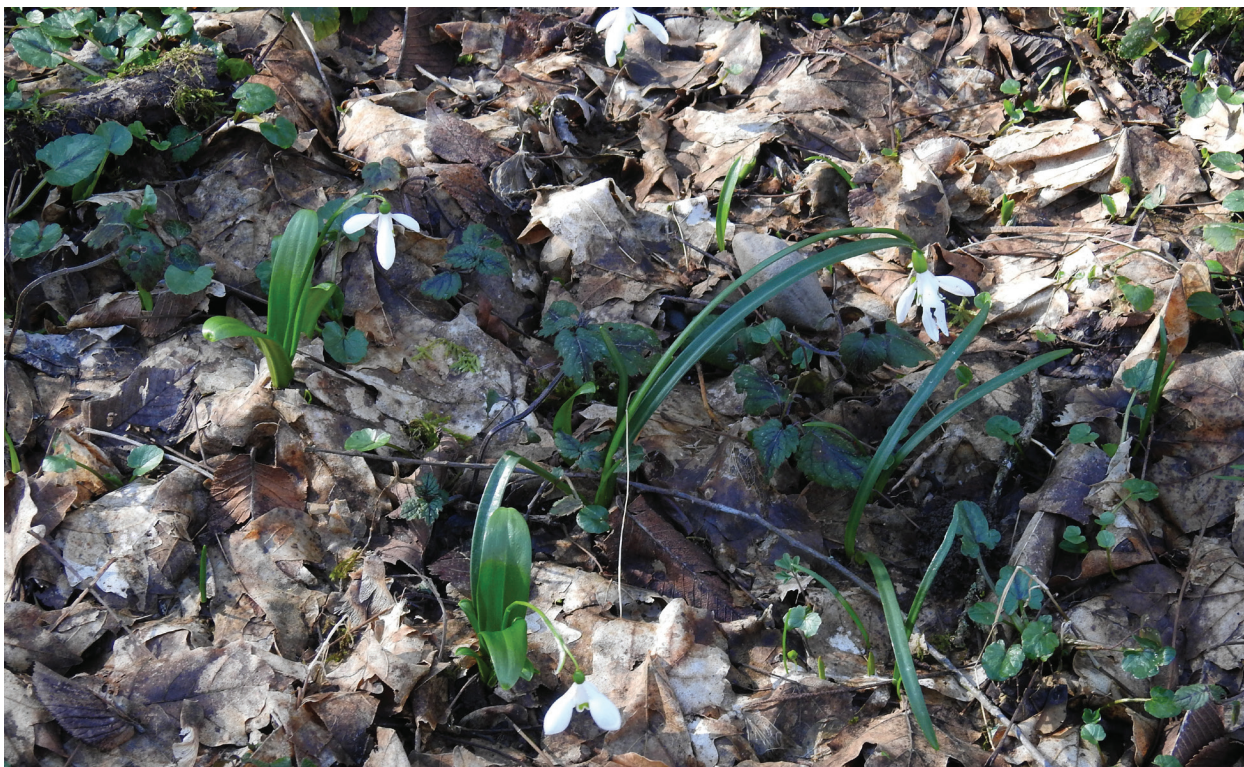
Рис. 7 / Fig. 7. Пример синтопии различных представителей рода Galanthus в окр. г. Сочи: G. woronowii и G. rizehensis в долине р. Псезуапсе, окр. с. Марьино.

ственных окр. пос. Красная Поляна известняковые скалы расположены на высотах, превышающих 1000 м над ур. м., и удалены как от предгорий (ареала G. lebedevae ), так и не совпадающие с высотным распространением G. lebedevae до 300 м над ур. м. Укажем, что даже сам пос. Красная Поляна расположен на высоте 550 м над ур. м. Таким образом, следует признать, что указанные в литературе данные о содержании ядерной ДНК у G. woronowii 56,3(56,2) пг (Zonneveld et al., 2003; Zubov, Davis, 2012) в действительности относятся к G. lebedevae . Возможно, это объясняется тем, что большинство анализированного материала, исходя из табл. 1, в статье В. J. M. Zonneveld et al. (2003) происходило из культуры, либо было получено в виде луковиц от третьих лиц, в том числе с неправильным определением. Явно реликтовый дизъюнктивный ареал G. lebedevae , сохранившегося в небольшом количестве предгорных известняковых каньонов, способствовал сохранению в северокавказском рефугиуме древнего вида с диплоидным набором хромосом и содержанием ДНК 56,14 пг. Более молодой, предположительно, также диплоидный вид G. woronowii (с содержанием ДНК 70,8 пг), согласно нашим гербарным сборам, достаточно широко распространен вдоль всего Западного