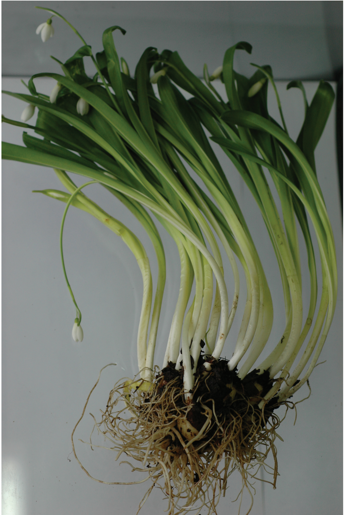
Рис. 2 / Fig. 2. Клон Galanthus lebedevae из Ахштырского ущелья (locus classicus), характерная пропорция длины листьев и цветоноса в фазу цветения.