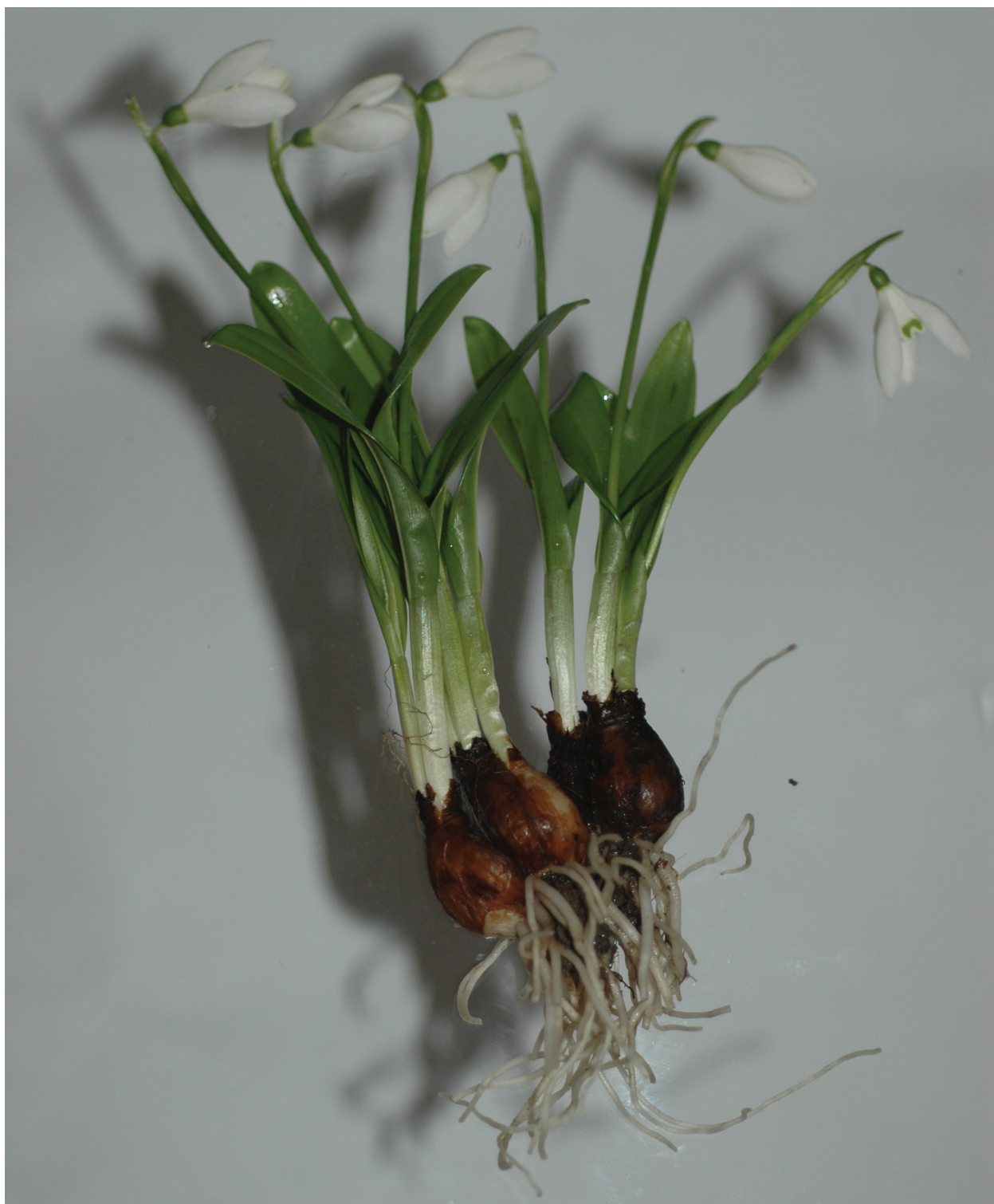
Рис. 4 / Fig. 4. Клон Galanthus woronowii из ущелья Цусхвадж, характерная пропорция длины листьев и цветоноса в фазу цветения.

серповидная изогнутость листа, не найденная у G. lebedevae . Цветки у G. lebedevae относительно мелкие (в сравнении с общим габитусом) и не широколепестные, как у G. woronowii . Наиболее крупные луковицы отмечены у G. lebedevae , как и самая интенсивная тёмно-коричневая, почти чёрная окраска внешних чешуй. Пересаженные