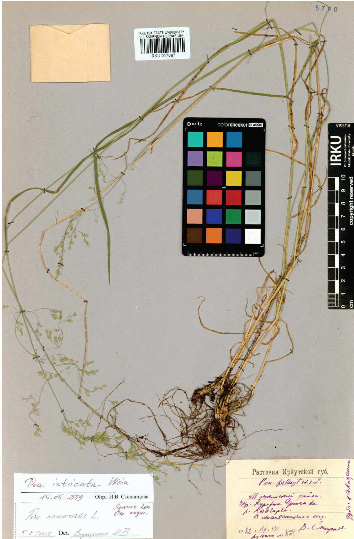
Рис. 1. Голотип Poa probatovae Olonova et Cherinoga, sp. nov. Общий вид. Fig. 1. Holotype of Poa probatovae Olonova et Cherinoga, sp. nov. General view.